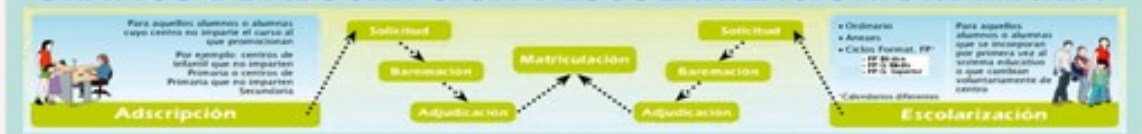
GRÁFICO DE ADSCRIPCIÓN Y ESCOLARIZACIÓN ORDINARIA